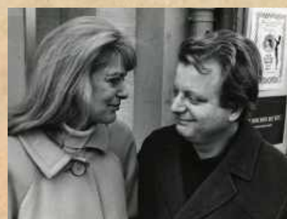
Robert Manthoulis et Melina Mercouri.