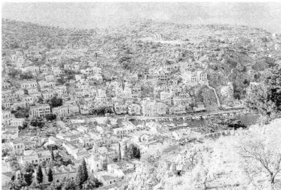
Ile de Symi