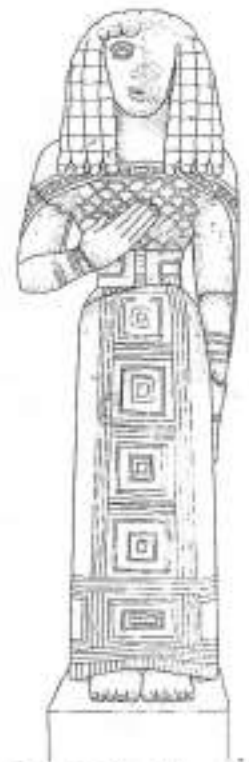
Dessin d'Isabelle Bradfer (coll. solo Louvre (16)