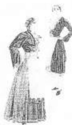
Costumes de Sfakia et d'Anogia