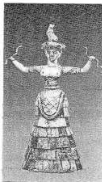
Déesse aux serpents / Musée d'Héraklion